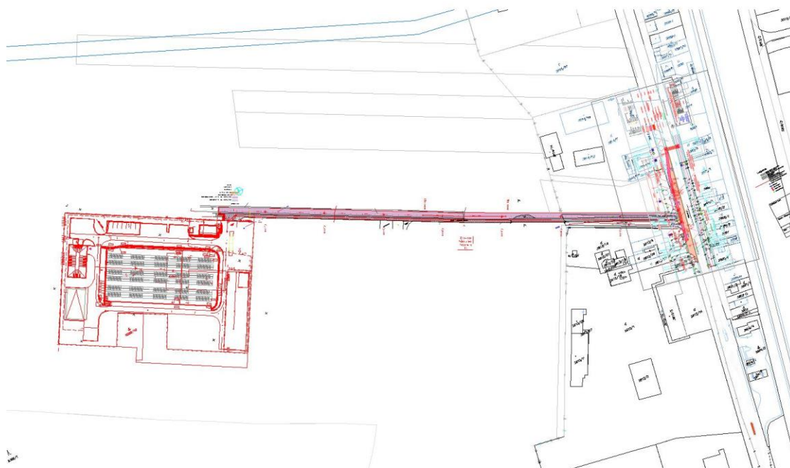
Obr.2: Napojenie kompostárne na cestu I/2